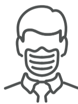
Uso adecuado del barbijo en espacios interiores, incluyendo los ámbitos laborales, educativos, sociales y el transporte público