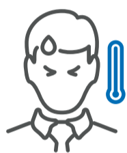
Fiebre de 37,5°C

Ante presencia de síntomas evitar el contacto con otras personas, no acudir a actividades laborales, sociales, educativas, lugares públicos y evitar el uso de transporte