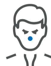
Rinitis / congestión nasal