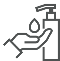
Mantener la higiene adecuada y frecuente de manos