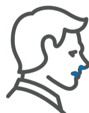
Pérdida del gusto u olfato